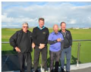
Vinnande Lag Guy